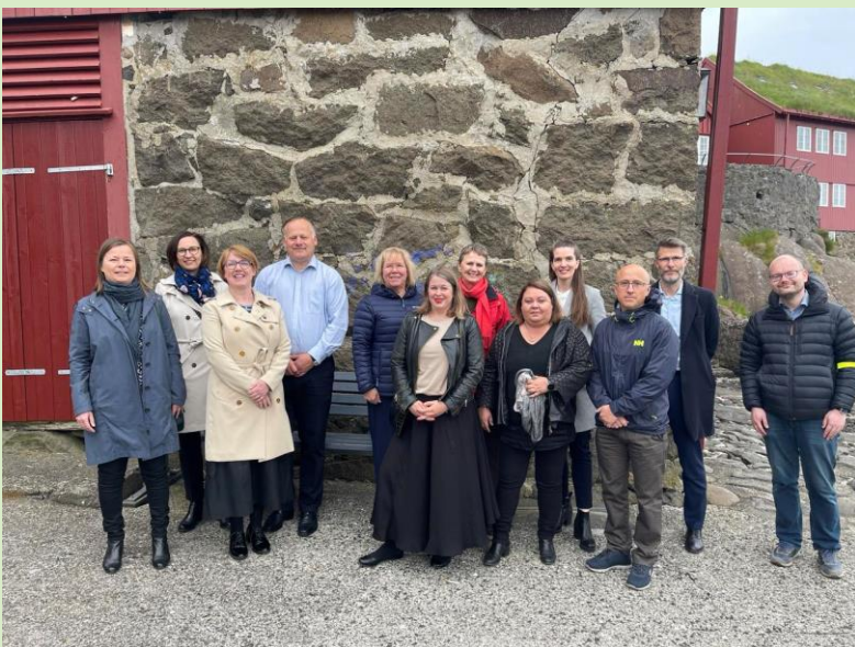
Umboð fyri norðurlensku brúkaraumboðini á fundi í Føroyum.

Norðurlensku brúkaraumboðini eru tí samd um at økja norðurlensku arbeiðsorkuna til talgilda og dátustýrda handilssiðvenju. Arbeiðsorkan fer at halda fram við sínámillum arbeiðinum fyri at kunna um besta arbeiðslag, men fer eisini fyri at taka tøk saman at berja niður talgilda og dáturikna siðvenju, sum hevur so ógvisluga ávirkan á brúkaraval og avgerðir. Harumframt fara norðurlensku brúkaraumboðini við sameindari styrki at halda fram at hækka støðið og fáa eina betri fatan av, hvussu hesin framferðarháttur ávirkar brúkararnar. Hetta er eitt týðandi næsta stig hjá norðurlensku brúkaraumboðinum í arbeiðinum fram ímóti sonnum talgildum rættvísi á brúkaramarknaðinum.